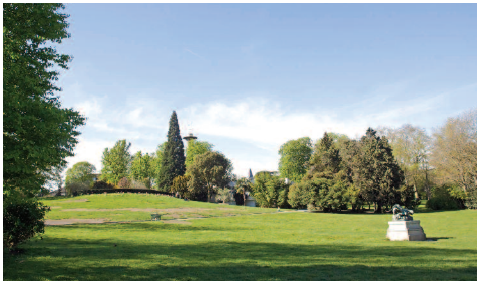
Le Parc Montsouris

Ici tout est fait pour offrir un style de vie prisé dans une résidence de prestige qui ne cessera de séduire par son emplacement et sa réalisation exceptionnels.