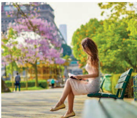
Vers la Tour Eiffel