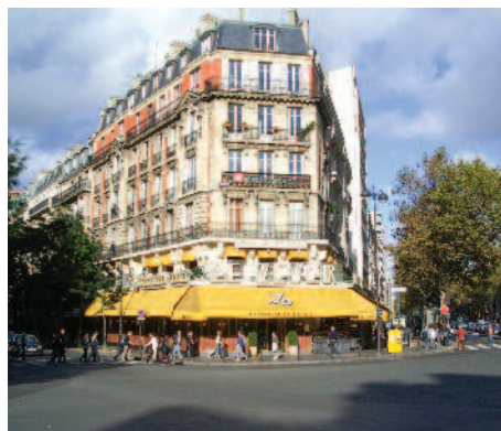
La place d'Alésia