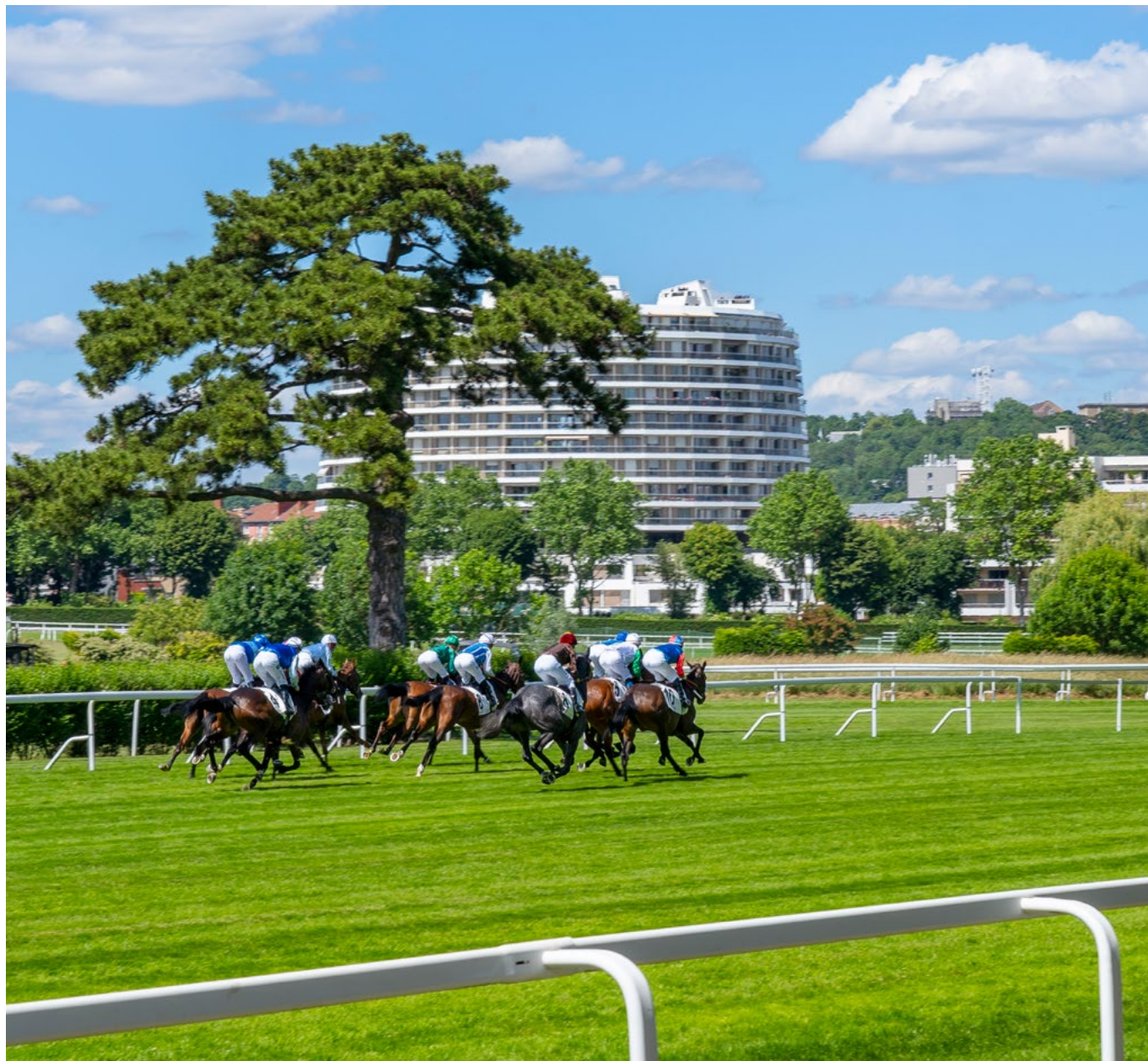
Hippodrome de Saint-Cloud