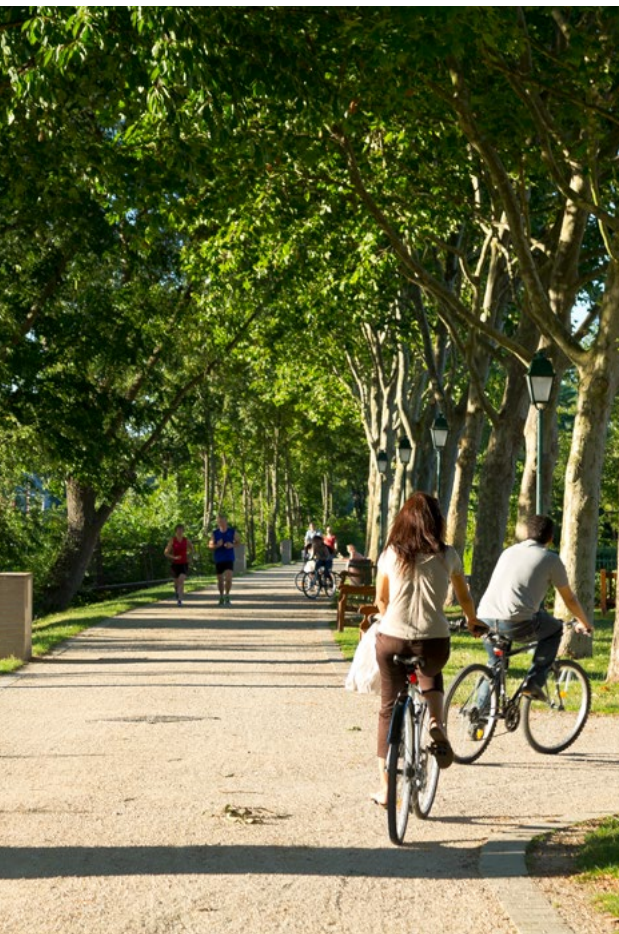
Quai de Halage