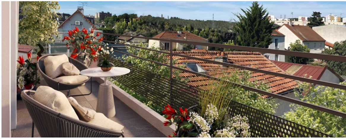
Le 81 Foch - Neuilly-Plaisance