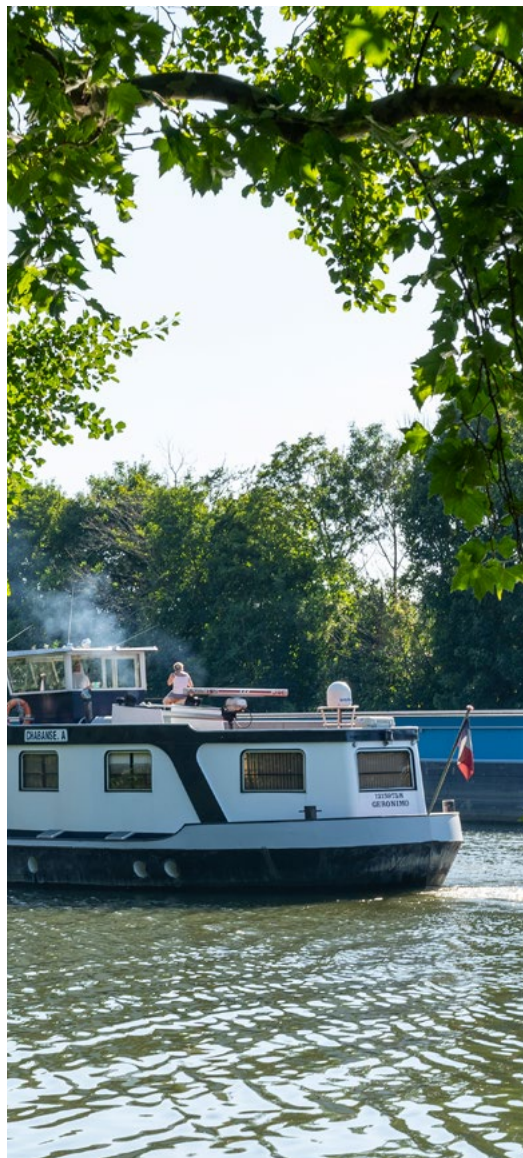
Bord de Seine