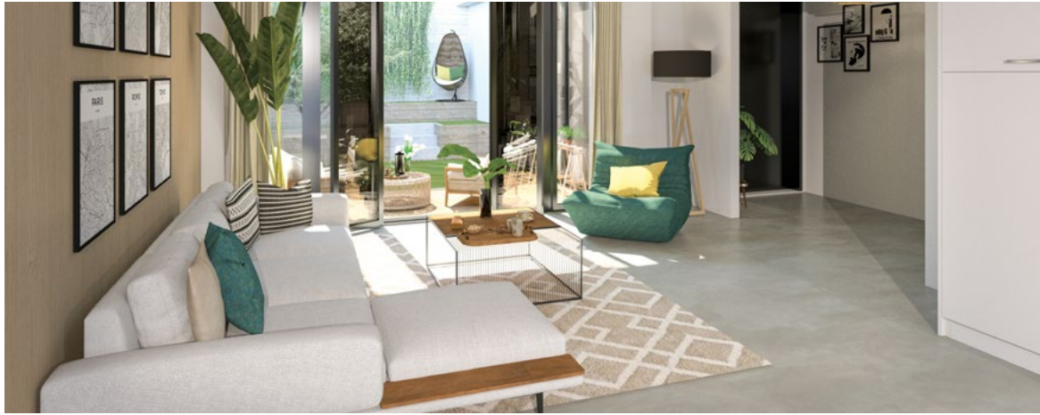
Le Tryptique - Paris XIV*